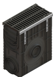
Camin + Gratar

BASE sealant, construction products, 310 ml tube (G12M29-C).