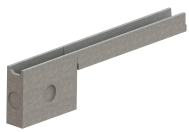
Conexiune camin colector