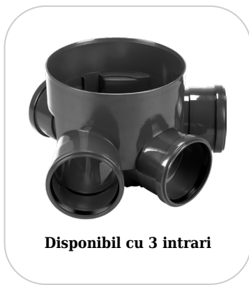
Disponibil cu 3 intrari

Etanșant BASE, produse pentru construcții, tub 310 ml (G12M29-C).