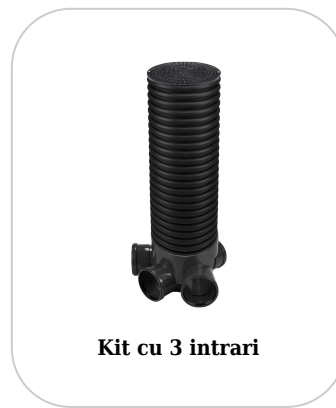
Kit cu 3 intrari