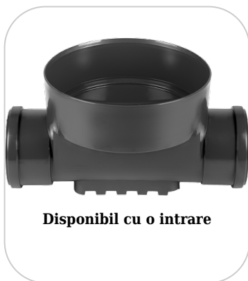
Disponibil cu o intrare