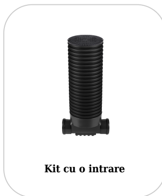
Kit cu o intrare