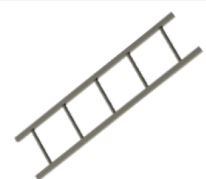
Scara aluminiu CLEAN L=1500 (SCALRP1500)