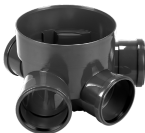
Disponibil cu 3 intrari

Etanșant BASE, produse pentru construcții, tub 310 ml (G12M29-C).