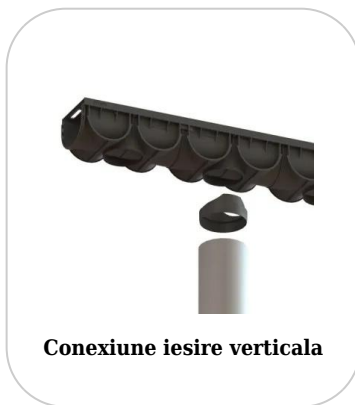
Conexiune iesire verticala

Etanșant BASE, produse de construcții, tub de 310 ml (G12M29-C).