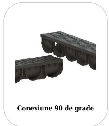
Conexiune 90 de grade