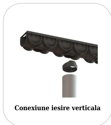
Conexiune iesire verticala

Etanșant BASE, produse de construcții, tub de 310 ml (G12M29-C).