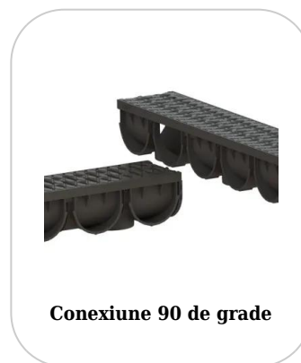
Conexiune 90 de grade