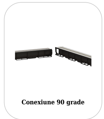
Conexiune 90 grade