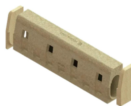
Conexiune placi de capat