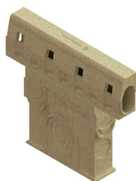
Conexiune camin colector