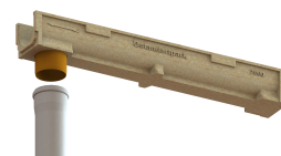
Disponibil si cu conexiune verticala