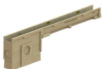
Conexiune camin colector

Etanșant BASE, produse pentru construcții, tub 310 ml (G12M29-C).