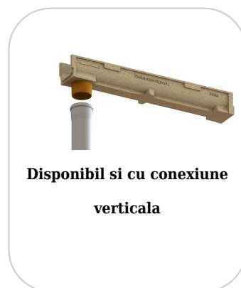
Disponibil si cu conexiune verticala