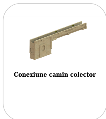
Conexiune camin colector

Etanșant BASE, produse pentru construcții, tub 310 ml (G12M29-C).