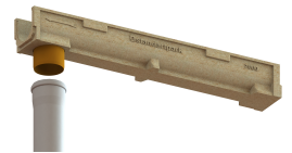
Disponibil si cu conexiune verticala