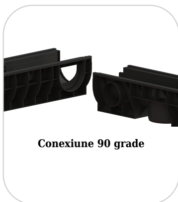
Conexiune 90 grade

Etanșant BASE, produse de construcții, tub de 310 ml (G12M29-C).