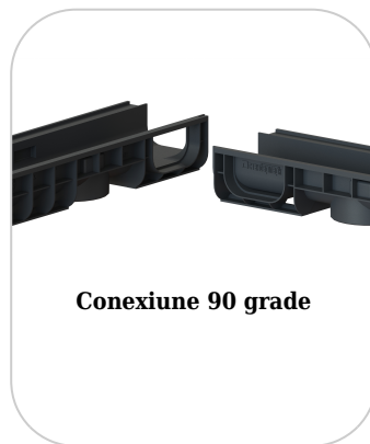
Conexiune 90 grade