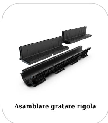
Asamblare gratare rigola

Etanșant BASE, produse pentru construcții, tub 310 ml (G12M29-C).