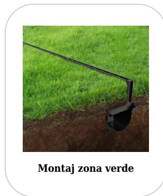
Montaj zona verde