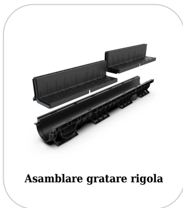
Asamblare gratare rigola

Etanșant BASE, produse pentru construcții, tub 310 ml (G12M29-C).