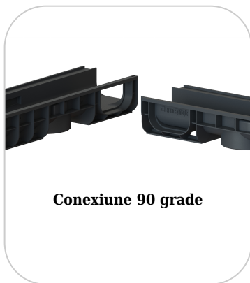
Conexiune 90 grade

Etanșant BASE, produse pentru construcții, tub 310 ml (G12M29-C).