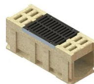
Element inspectie rigola PB MONO LN300 Hext.410 fara baza, cu gratar FONTA E600 1000x385x410 (0779458)