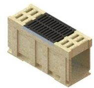
Element inspectie rigola PB MONO LN300 Hext.510 fara baza, cu gratar FONTA E600 1000x385x510 (0779558/510)