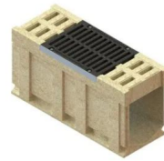
Element inspectie rigola PB MONO LN300 Hext.510 cu gratar FONTA E600 1000x385x510 (0779557/510)