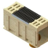
Element inspectie rigola PB MONO LN300 Hext.510 gratar FONTA E600 iesire verticala DN250 1000x385x510 (077955709/510)