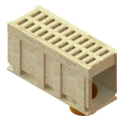
Rigola PB MONO LN300 Hext.510 E600 cu iesire verticala DN250 1000x385x510 (7795509/510)