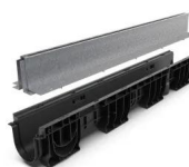
Kit rigola PP BASE LN100 Htot.250 gratar OZ tip Fanta T H100mm A15-C250