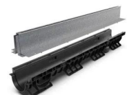
Kit rigola PP BASE LN100 Htot.220 gratar OZ tip Fanta T H100mm A15-C250 1000x156x220 (080201T100)