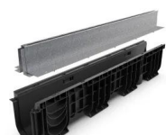
Kit rigola PP BASE LN100 Htot.300 gratar OZ tip Fanta T H100mm A15-C250