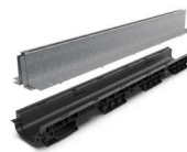
Kit rigola PP BASE LN100 Htot.180 gratar OZ tip Fanta T H100mm A15-C250 1000x156x180 (080101T100)