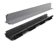
Kit rigola PP BASE LN100 Htot.160 gratar OZ tip Fanta T H100mm A15-C250 1000x156x160 (080501T100)