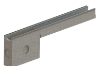
Conexiune camin colector

Etanșant BASE, produse pentru construcții, tub 310 ml (G12M29-C).