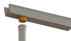
Disponibil si cu conexiune verticala