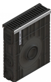
Camin + Gratar

BASE sealant, construction products, 310 ml tube (G12M29-C).