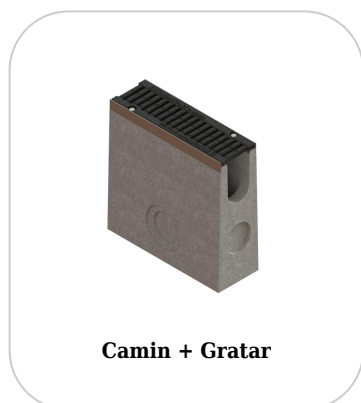
Camin + Gratar

Etanșant BASE, produse pentru construcții, tub 310 ml (G12M29-C).