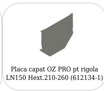
Placa capat OZ PRO pt rigola LN150 Hext.210-260 (612134-1)