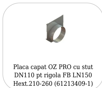
Placa capat OZ PRO cu stut DN110 pt rigola FB LN150 Hext.210-260 (61213409-1)