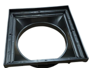
Rama pentru teava

Etanșant BASE, produse pentru construcții, tub 310 ml (G12M29-C).